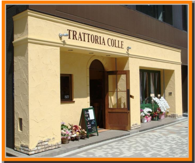
施工事例(東京都:イタリアンレストラン)